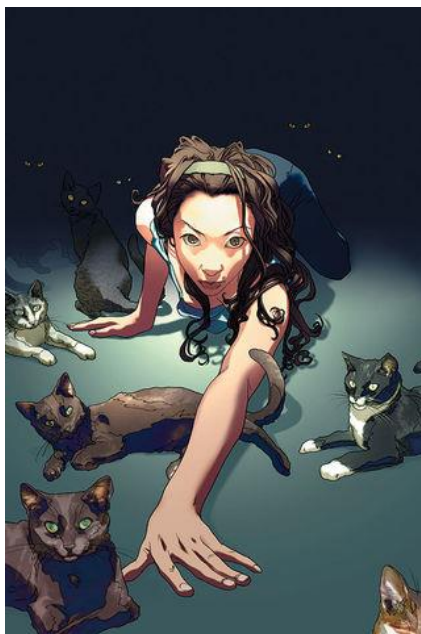
Figura 3. Tatiana Caban. Arte por Joshua Middleton.